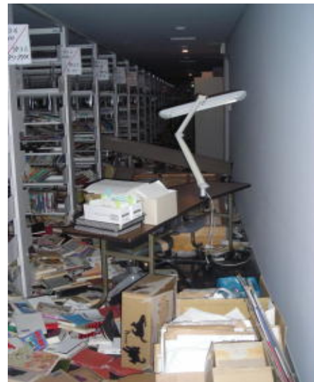
3階一般図書閉架書庫(H23.3.11 撮影)