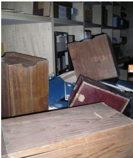
4階貴重資料書庫(H23.3.11 撮影)