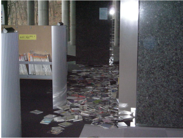
1階視聴覚室 (H23.3.11 撮影)