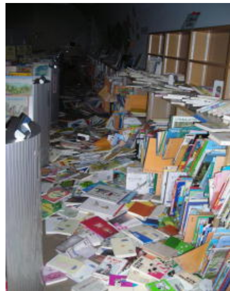
2階こども図書室(H23.3.11 撮影)