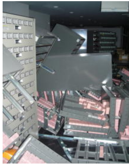
4階マイクロフィルム保管庫(H23.3.11 撮影)