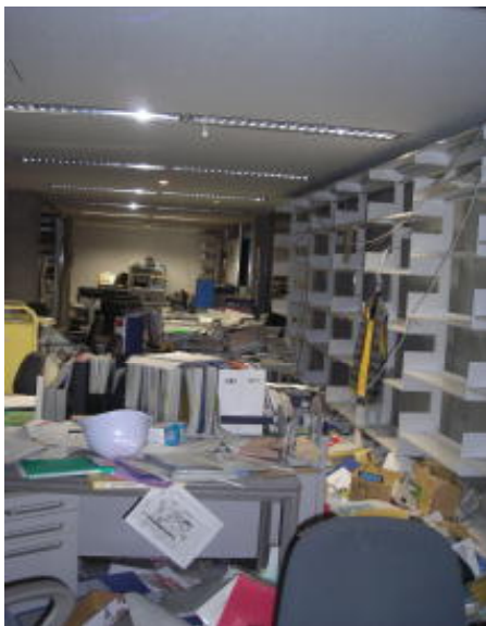
3階一般図書ワーク(H23.3.11 撮影)