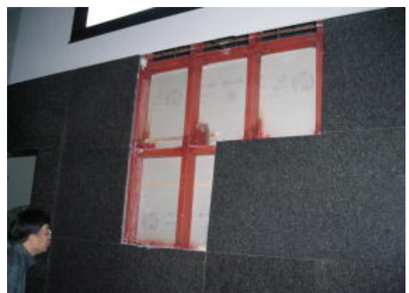
2階養賢堂正面壁(H23.3.11 撮影)