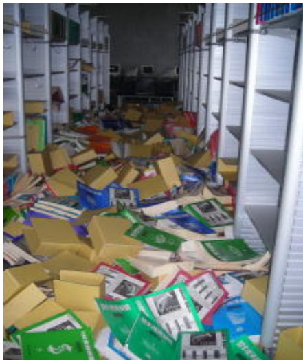
3階逐刊開架書庫(H23.3.11 撮影)