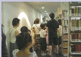
古い本などが並んでいる閉架書庫を見学