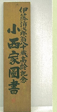
小西家の文庫に揚げられていた看板