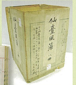
篁洲手製の『仙台風藻』カバー